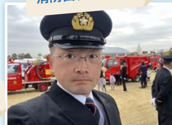
消防出初式に参加