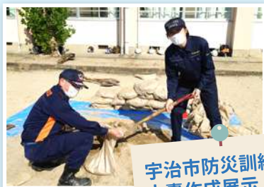
宇治市防災訓練にて 土嚢作成展示